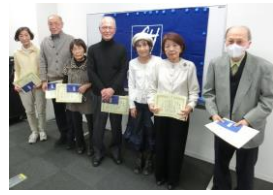
秀逸受賞の各位と会場風景